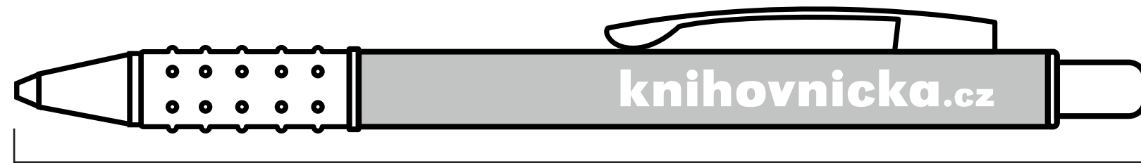
čelní strana propisky

velikost propisky je 13,5 cm s průměrem 1 cm